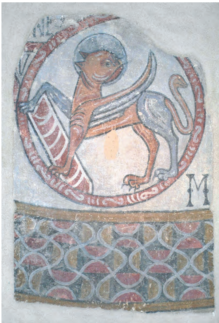
Fig. 2 : Évangéliste, Marc, Hospice d'Ille-sur-Têt.