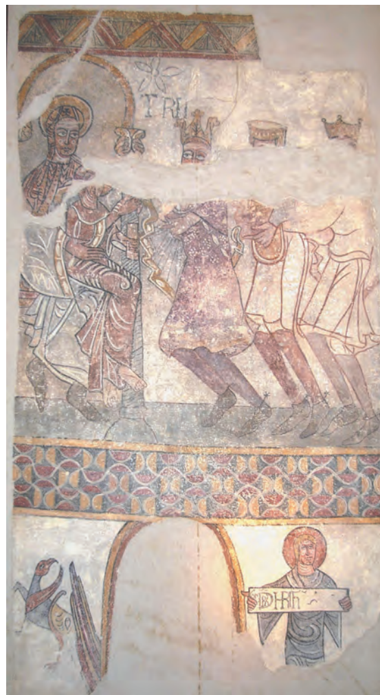
Fig. 5 : Adoration des Mages, Hospice d'Ille-sur-Têt.

Dans le panneau inférieur, de part et d'autre de la fenêtre, on apercevait un griffon et un personnage déployant un phylactère avec une épigraphe qui a perdu la partie droite. L'inscription en lettres capitales, très difficile à déchiffrer, est tracée en noir dans un rectangle blanc, avec quelques lettres à l'envers : GNLBR-CHRTIH. Selon nous, ce texte doit être lu de la manière suivante : G(e)N(erationis) L(i)B(e)R CHRI(s)T(i) IH(esu), car il s'agit du début de l'Évangile de Matthieu : « Liber generationis Iesu Christi filii David, filii Abraham » (Mt. 1, 1). Il faut rappeler que les textes avec les débuts des quatre Évangiles étaient utilisés en Catalogne romane lors du rituel de la bénédiction de l'autel, d'après les indications de l' ordo catalano-narbonnais , comme l'attestent