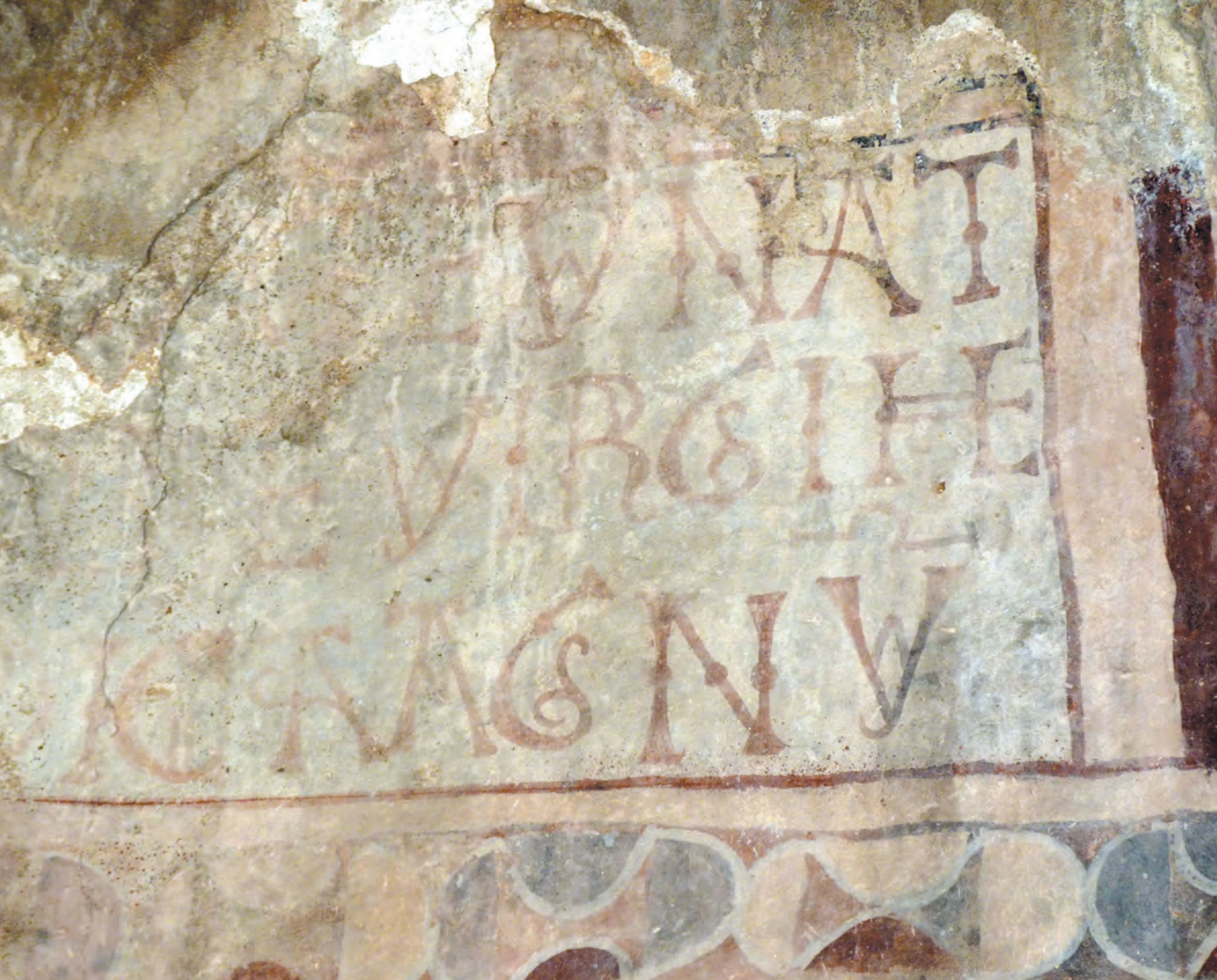
Fig. 4 : Inscription. Saint-Saveur de Casesnoves, abside, cul-de-four.