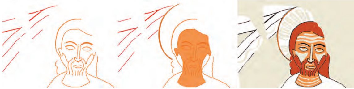
Fig. 13 : Casesnoves, visage du Christ — Hypothèse de reconstitution des principales étapes picturales (montage Photoshop A. Mazuir/J. Rollier, Arts et Métiers ParisTech).

Majesté, Marcel Simon a probablement repeint les pommettes et les plis du front. Malgré cela et par comparaison avec les autres visages, nous estimons que le peintre a travaillé en plusieurs couches successives :