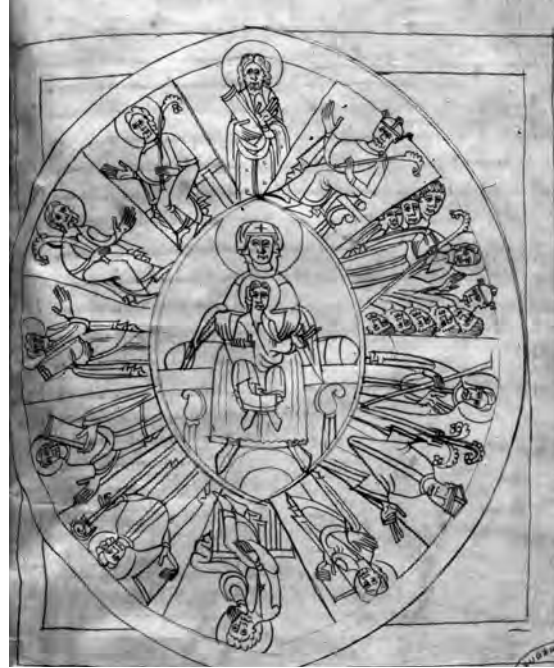
Fig. 12 : Évangélaire de Saint-Michel-de-Cuxa, ms. 1, f. 21.

semble être un vecteur de transport simple pour la diffusion des modèles, s'enrichissant, productions après productions des cultures qu'il traverse. L'origine locale d'un peintre formé dans un scriptorium , centre de production artistique, rayonnant sur ses possessions, est aussi tout à fait envisageable. En effet, un détail comme le dessin d'une croix sur le maphorion de la Vierge sur la scène de l'Épiphanie a été sans doute emprunté à des représentations de Marie de l'Évangéliste de Cuxa (f. 107r). De la même manière, le sacramentaire Moussoulens (vers 1100-1125), conservé au Trésor Notre-Dame de l'Abbaye à Carcassonne, dont les enlumineurs peuvent aussi être associés à la peinture catalane de la première moitié du XII e siècle, fait également partie des sources à considérer. Dans ce manuscrit, probablement réalisé dans un centre du Roussillon, Conflent ou Vallespir entre 1100 et 1125, se trouve une représentation de la Crucifixion (f. 10r), avec des personnifications du soleil