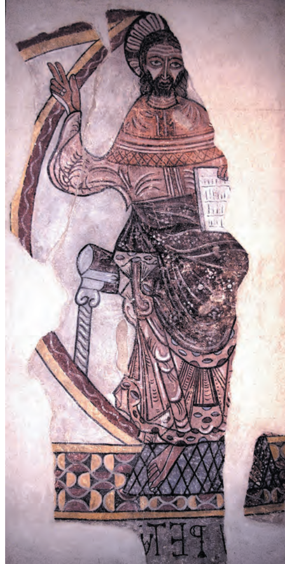
Fig. 1 : Christ en Majesté, Hospice d'Ille-sur-Têt.

Située à droite de l'abside, sur les parois du chœur, l'Adoration des Mages fait partie des panneaux aujourd'hui conservés à l'Hospice d'Ille-sur-têt. Une Vierge à l'Enfant était assise sous une arcade, outrepassée, et regarde s'approcher les trois rois mages couronnés et inclinés pour offrir leurs présents. L'étoile de Bethléem