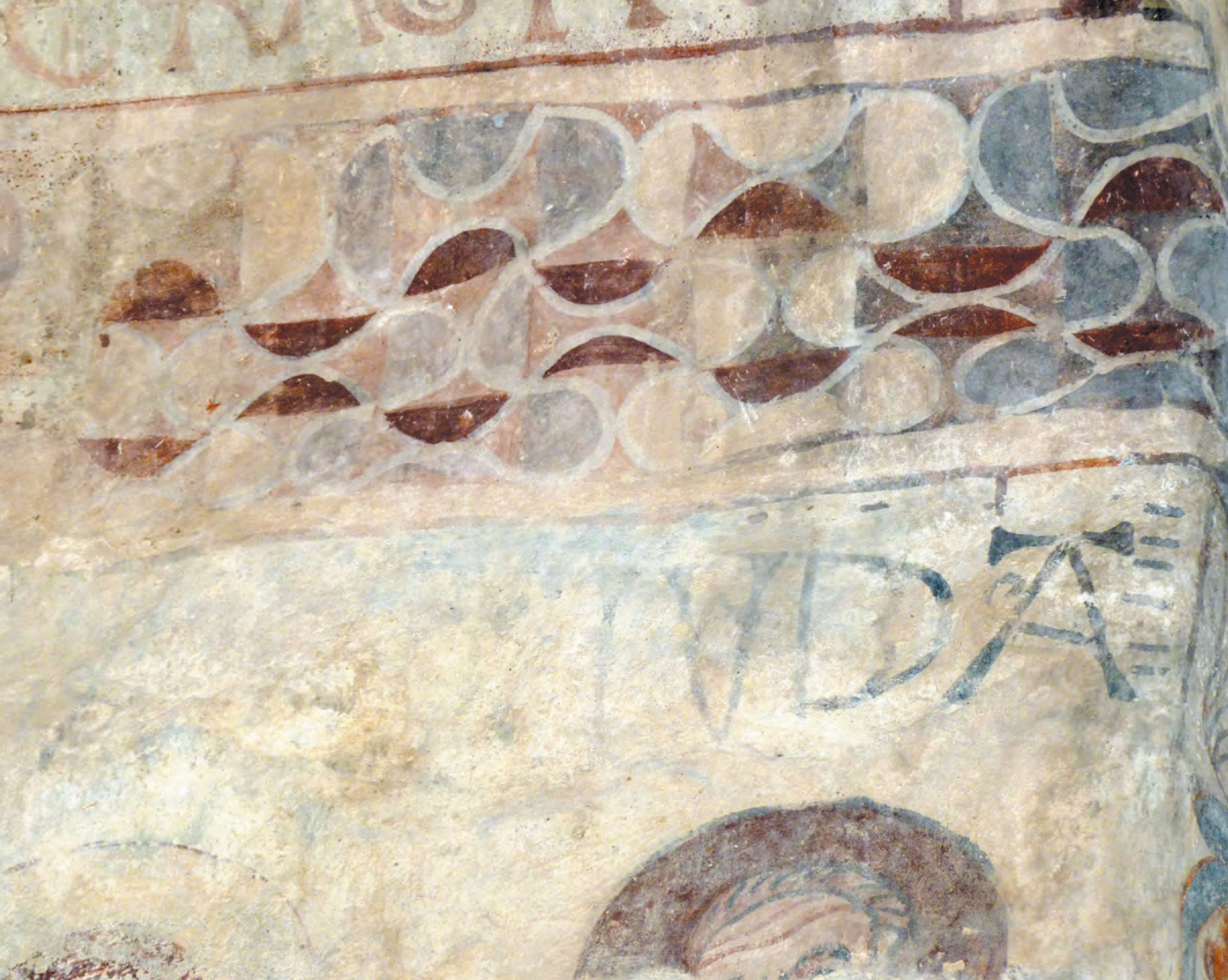
Fig. 7 : Inscription. Saint-Saveur de Casesnoves, abside.