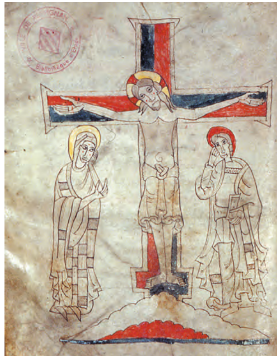
Fig. 11 : Missel à l'usage de l'abbaye Sainte-Marie d'Arles-sur-Tech, ms. 4, f. 2.