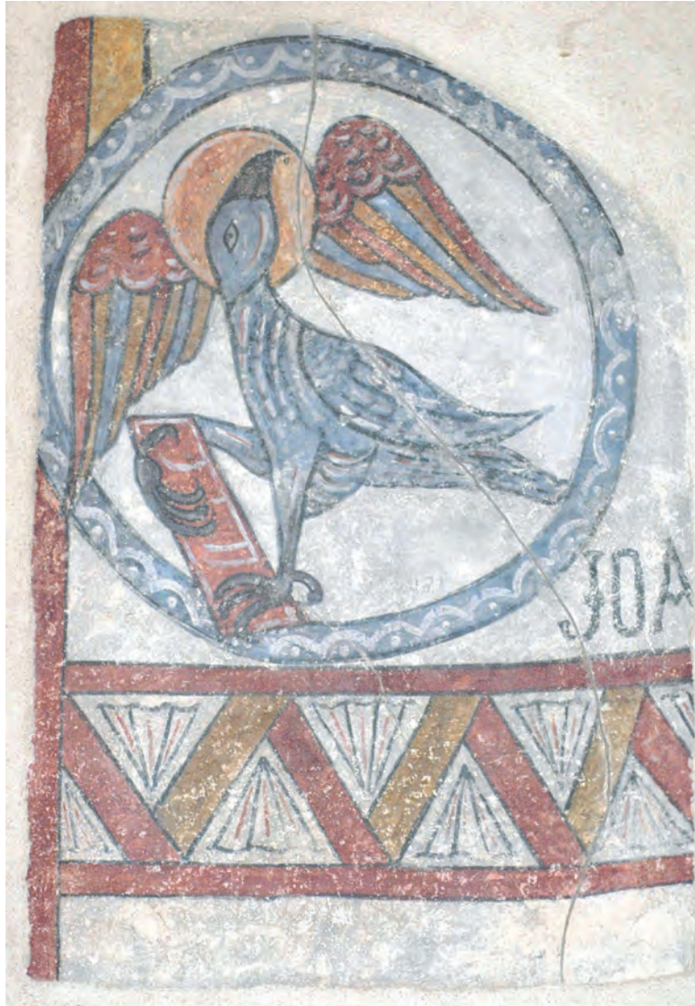
Fig. 3 : Évangéliste, Jean, Hospice d'Ille-sur-Têt.