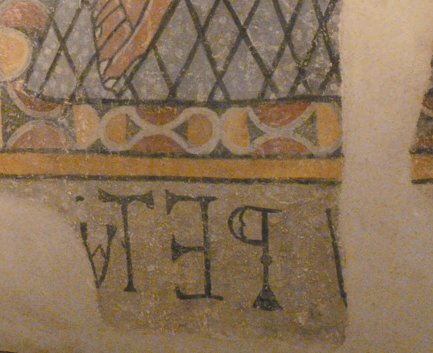
Fig. 10 : Inscription. Hospice d'Ille-sur-Têt.