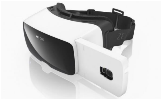
Figure 3. Casque VR ONE© mobile de réalité virtuelle

Ici aussi, l'approche expérimentale nous semblait être l'option méthodologique la plus appropriée pour répondre à l'objectif visé. L'étude a mobilisé 21 participants (2 femmes et 19 hommes). L'application utilisée, « King Tut VR2 », offre la possibilité aux participants de revivre la découverte du tombeau du pharaon Toutankhamon par Howard Carter.