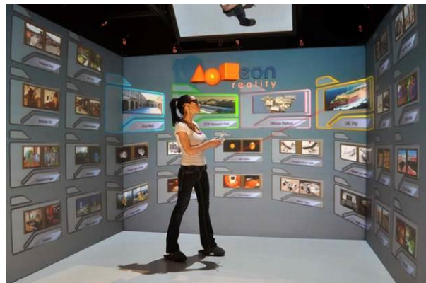
Figure 4. iCube (salle immersive de réalité virtuelle) de l'entreprise EON REALITY

Les premiers résultats statistiques (i.e., tests de Student) suggèrent une différence significative entre les deux périphériques. Ils révèlent une meilleure UX dans la salle immersive comparativement à celle perçue avec le casque de réalité virtuelle mobile. Ces résultats illustrent un exemple d'utilisation de notre questionnaire d'UX, vu comme une aide à la conception des IHEVI. Ici, le questionnaire a permis d'aider les concepteurs non seulement dans le choix d'un périphérique de réalité virtuelle pour une application ludo-éducative historique (la salle immersive semble mieux adaptée), mais aussi dans l'identification des composants à améliorer s'ils souhaitent toutefois opter pour le casque de réalité virtuelle mobile (e.g., réduire la vitesse des mouvements en avant pour une réduire les conséquences de l'expérience néfastes). Cette étude a fait l'objet d'une publication soumise dans une conférence internationale.