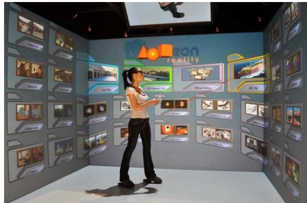
Figure 4. iCube (salle immersive de réalité virtuelle) de l'entreprise EON REALITY

Les premiers résultats statistiques (i.e., tests de Student) suggèrent une différence significative entre les deux périphériques. Ils révèlent une meilleure UX dans la salle immersive comparativement à celle perçue avec le casque de réalité virtuelle mobile. Ces résultats illustrent un exemple d'utilisation de notre questionnaire d'UX, vu comme une aide à la conception des IHEVI. Ici, le questionnaire a permis d'aider les concepteurs non seulement dans le choix d'un périphérique de réalité virtuelle pour une application ludo-éducative historique (la salle immersive semble mieux adaptée), mais aussi dans l'identification des composants à améliorer s'ils souhaitent toutefois opter pour le casque de réalité virtuelle mobile (e.g., réduire la vitesse des mouvements en avant pour une réduire les conséquences de l'expérience néfastes). Cette étude a fait l'objet d'une publication soumise dans une conférence internationale.