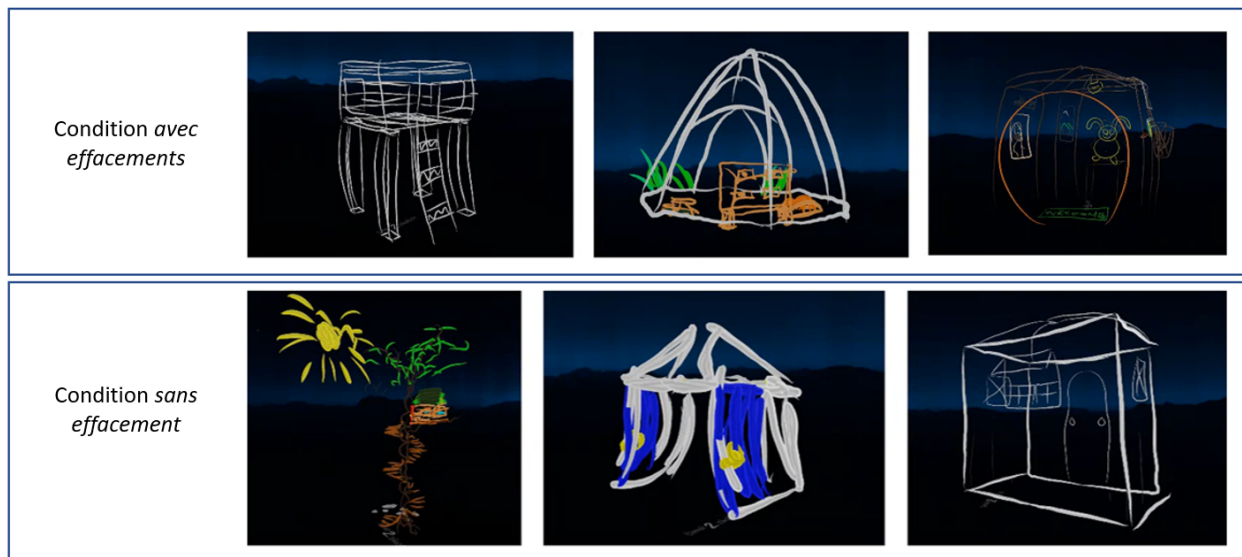
Figure 2. Quelques exemples de cabanes réalisées

Après des tests de Levene pour vérifier l'homogénéité des variances des mesures, les comparaisons de groupes ont été effectuées à l'aide de tests paramétriques pour données appariées ou de tests non paramétriques de Wilcoxon. La Figure 3 montre les moyennes et écarts-types pour les réponses aux questions concernant le ressenti des utilisateurs. Les comparaisons inférentielles indiquent que les différences sont significatives pour ce qui