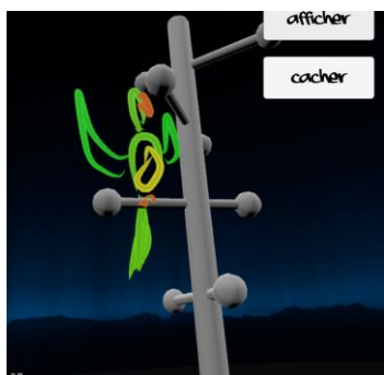
Figure 1 : Exemple d'idées produites par les participants (Un arrosoir, une lampe et un perchoir à oiseau)

Cette étude préliminaire s'inscrit dans le cadre de travaux plus large sur la compréhension des effets de la réalité virtuelle sur l'expérience créative et de l'utilisation des données physiologiques pour la détection et l'anticipation des états créatifs.