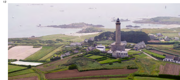
5.4.2.1.A. — Phare de l'île de Batz, au SW (2012).

07 Vue du Nord, l'île de Batz montre la tour du sémaphore (48° 44,78' N – 4° 00,69' W) et surtout le phare (48° 44,72' N – 4° 01,61' W), tour grise haute de 43 m, entourée de maisons. L'île est débordée de tous côtés par des dangers. Les plus au large sont : – à l'Est, la Basse Astan , couverte de 0,8 m d'eau, marquée par la bouée « Astan » (48° 44,91' N – 3° 57,66' W), cardinale Est lumineuse ; – au Nord, la Grande Basse (48° 45,92' N – 4° 01,64' W), couverte de 0,5 m d'eau ; – à l'Ouest, Men Aodi (48° 44,64' N – 4° 03,39' W), roche non balisée découvrant de 0,1 m.