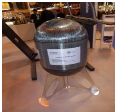
Fig. 1: Réservoir type IV haute pression 95L/700bar Poids 85Kg

Mots clefs: Bobinage, Matériaux Composites, Réservoir