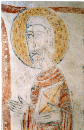
Burnand, église Saint-Nizier, détail d'un apôtre.