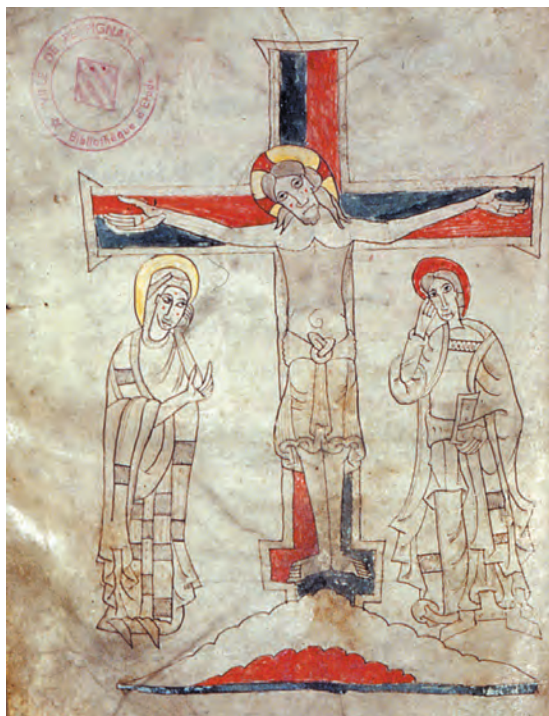
Fig. 11 : Missel à l'usage de l'abbaye Sainte-Marie d'Arles-sur-Tech, ms. 4, f. 2.