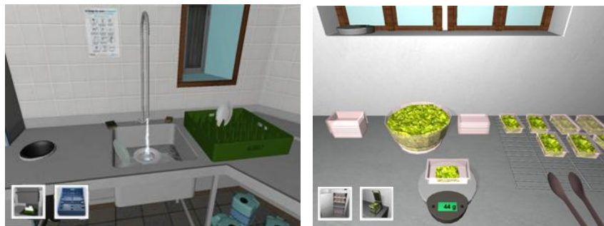
Figure 2. Activité de plonge (a) et de remplissage de barquettes (b)

Le projet Apticap consiste à réaliser un nouvel outil, s'appuyant sur les technologies de la réalité virtuelle, adapté aux besoins d'un ESAT. Cet outil vise à aider au quotidien les moniteurs de l'ESAT (i.e., les éducateurs) dans l'orientation et la formation des travailleurs handicapés. Deux tâches ont été conçues en virtuel : la « plonge » (Figure 2a) et le « remplissage de barquettes » (Figure 2b). L'artefact conçu correspond au logiciel de formation et d'orientation, reproduisant les lieux et tâches réels. Les utilisateurs finaux de cet outil sont des travailleurs handicapés (apprentissage) et les moniteurs (gestion).