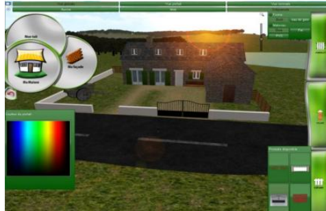
Figure 4. Logiciel d'aide à la vente de portails

Le projet Tactimerlin a pour objectif la réalisation d'un outil d'aide à la vente destiné à une grande surface de bricolage. Le logiciel produit, présenté sous la forme d'une borne tactile de grandes dimensions, permet aux clients du magasin de découvrir l'ensemble d'une famille de produits (ici les portails) et de concevoir leur projet personnalisé d'aménagement dans un environnement virtuel 3D réaliste (Figure 4). L'artefact conçu est un logiciel d'aide au choix et au dimensionnement d'un portail. Les utilisateurs finaux sont une population d'utilisateurs grand public susceptibles d'acheter un portail.