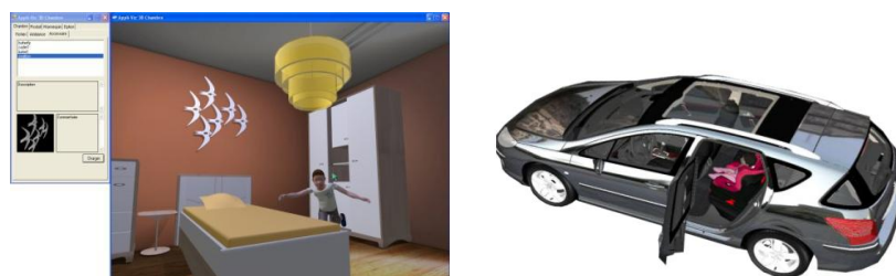
Figure 3. Environnement chambre (a) et voiture (b)

Le projet Appli-Viz'3D est un outil collaboratif d'aide à la décision en conception. Il permet la mise en situation de prototypes et d'avatars dans des environnements virtuels 3D réalistes. Il a pour objectif de permettre aux concepteurs d'un produit de mettre en scène et d'évaluer rapidement des concepts. C'est ainsi un outil d'aide à la décision qui permet une visualisation 3D d'éléments en cours de création. Ce logiciel permet également aux commerciaux des entreprises de présenter des concepts de produits de manière interactive (Figure 3) dans leurs environnements d'utilisation (chambre d'enfant et un habitacle de voiture). L'artefact conçu concerne ici donc le logiciel d'aide au choix de concept de produits de puériculture (par ex., un meuble, un siège auto). Les utilisateurs finaux de ce logiciel sont une population d'utilisateurs professionnels (designers, marketeurs, ingénieurs).