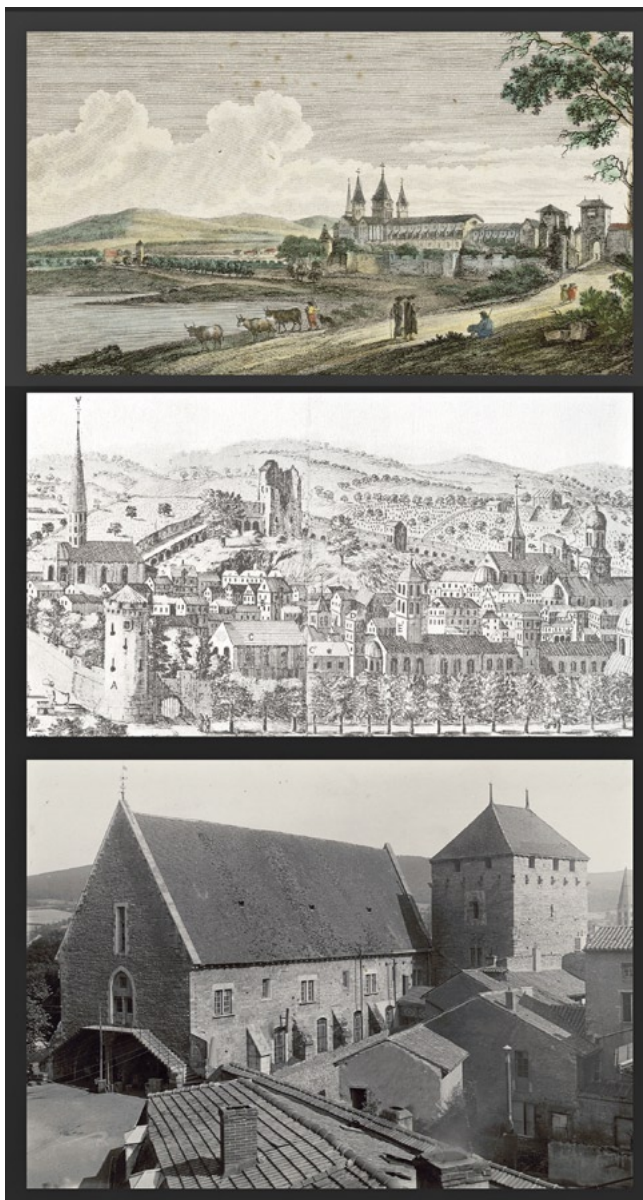
Fig. 1 – a. Vue de Cluny depuis le Nord, gravure par Née d'après un dessin de J.B. Lallemand, XVIII e et XIX e s. (Musée d'art et d'archéologie, 76.199); b. Abbaye et ville de Cluny, gravure de Louis Prévost, vers 1670 (Bnf); c. Cluny, farinier et tour du moulin, photo de K.J. Conant (Musée d'art et d'archéologie).