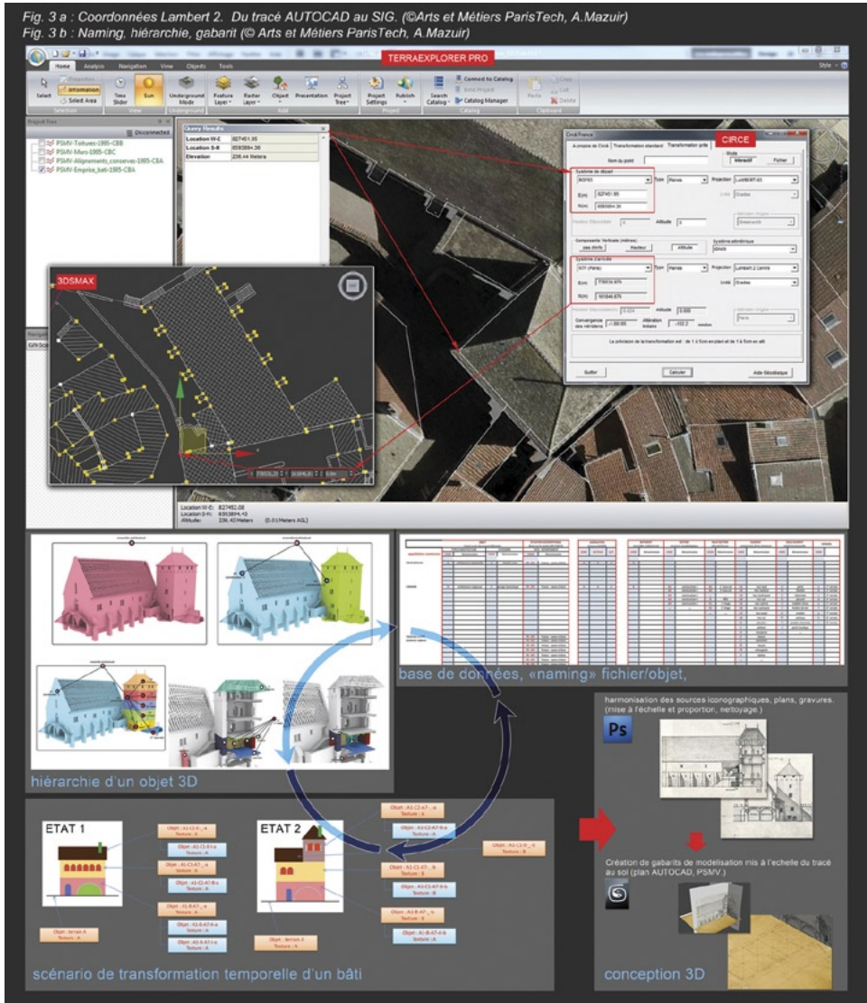
Fig. 3 – a. Coordonnées Lambert 2. Du tracé AutoCAD au SIG (Arts et Métiers ParisTech, A. Mazuir); b. Naming, hiérarchie, gabarit (Arts et Métiers ParisTech, A. Mazuir).

qui sont mises aux proportions dans le logiciel Photoshop. Dans 3ds Max le tracé de la zone de travail est dupliqué et ramené en coordonnées 0-0-0 pour corriger les problèmes de précision dans les manipulations, ou opérations d'édition des objets. À l'aide de prises de mesures sur site, complétées par des