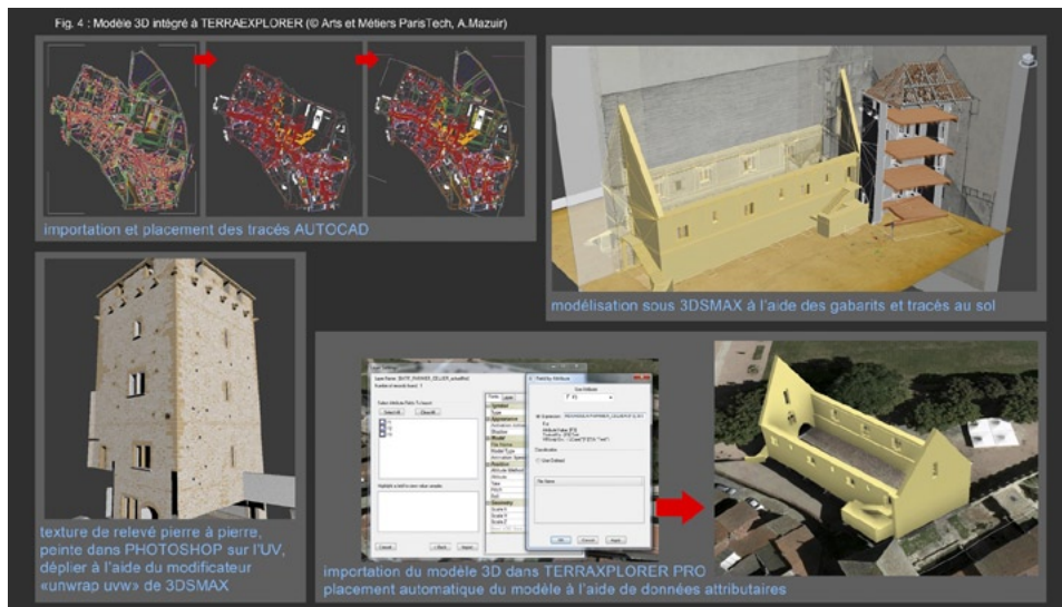
Fig. 4 – Modèle 3D intégré à TerraExplorer (Arts et Métiers ParisTech, A. Mazuir).