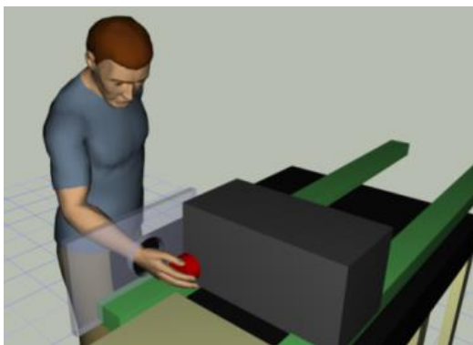
Figure 3. Mannequin virtuel

L'intérêt de ces logiciels est reconnu par la norme pour évaluer l'ergonomie physique lors de la conception de machines [NF EN1005-4, 2005]. Ils sont en effet utilisés afin d'évaluer les facteurs de risques biomécaniques des postes de travail, en simulant et analysant les mouvements et les efforts des futurs opérateurs. Un mouvement prescrit n'est toutefois jamais exécuté ni reproduit exactement de la même manière, que ce soit pour un même sujet à des moments différents, ou pour des sujets différents. Ces variations, que l'on choisit de désigner dans la suite de cet article sous le terme de « variabilité du mouvement », doivent donc être prises en compte par les concepteurs, pour que l'évaluation des risques de la situation de travail envisagée repose sur des données aussi représentatives que possible de l'activité future. Pourtant, en conception, cette variabilité est généralement négligée, voire ignorée [Gaudez et al., 2016].