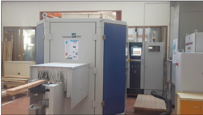
Photo 1 Scanner d'analyse optique et rayons X de l'ENSAM de Cluny