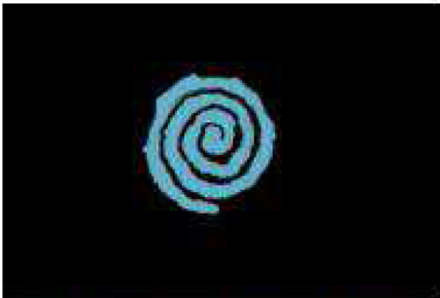
(c) Opération logique de soustraction pour obtenir le volume d'ablation