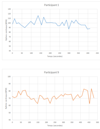
Figure 2 : Graphiques d'exemple d'évolution du rythme cardiaque de participants (Exemple d'évolution du rythme cardiaque d'un participant du groupe sans induction de stress (BPM/s) ; Exemple d'évolution du rythme cardiaque d'un participant du groupe avec induction de stress (BPM/s)).