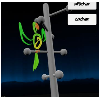
Figure 1 : Exemple d'idées produites par les participants (Un arrosoir, une lampe et un perchoir à oiseau)

Cette étude préliminaire s'inscrit dans le cadre de travaux plus large sur la compréhension des effets de la réalité virtuelle sur l'expérience créative et de l'utilisation des données physiologiques pour la détection et l'anticipation des états créatifs.