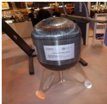
Fig. 1: Réservoir type IV haute pression 95L/700bar Poids 85Kg

Mots clefs: Bobinage, Matériaux Composites, Réservoir