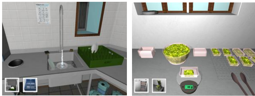
Figure 2. Activité de plonge (a) et de remplissage de barquettes (b)

Le projet Apticap consiste à réaliser un nouvel outil, s'appuyant sur les technologies de la réalité virtuelle, adapté aux besoins d'un ESAT. Cet outil vise à aider au quotidien les moniteurs de l'ESAT (i.e., les éducateurs) dans l'orientation et la formation des travailleurs handicapés. Deux tâches ont été conçues en virtuel : la « plonge » (Figure 2a) et le « remplissage de barquettes » (Figure 2b). L'artefact conçu correspond au logiciel de formation et d'orientation, reproduisant les lieux et tâches réels. Les utilisateurs finaux de cet outil sont des travailleurs handicapés (apprentissage) et les moniteurs (gestion).