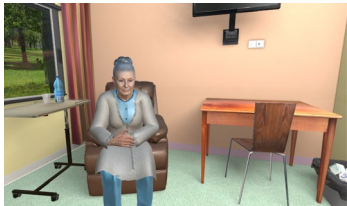
Figure 3 : Intégration de l'humain virtuel expressif au sein d'un simulateur en santé

faciales affecte positivement la perception de l'agent virtuel par l'utilisateur, son attitude et sa motivation, mais également son apprentissage [10]. Enfin, les émotions chez l'humain virtuel expressif permettraient de diminuer le stress des participants et de mieux surmonter les difficultés [11].