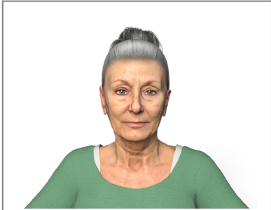
Figure 2 : Rendu de l'humain virtuel expressif