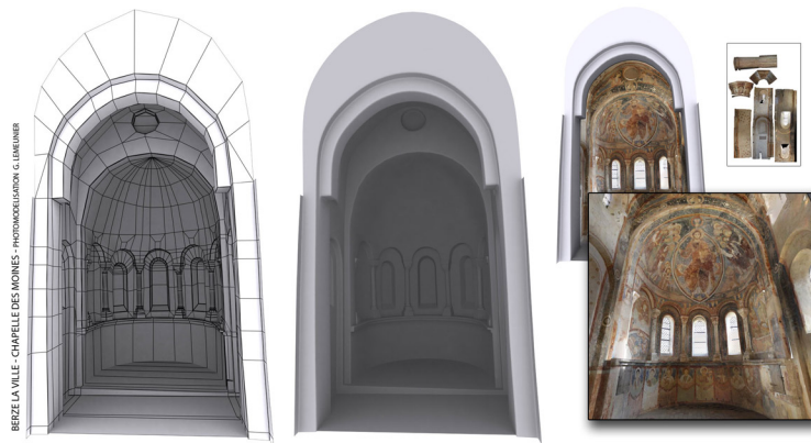
Berzé-la-Ville, la Chapelle-des-Moines, photomodélisation 3D.