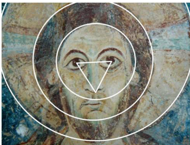
Berzé-la-Ville, la Chapelle-des-Moines, visage du Christ.