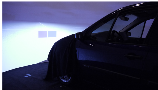
Figure 1: Condition expérimentale

L'expérience a été réalisée au sein du simulateur d'éclairage Renault où, hormis les projecteurs, l'ensemble des lumières et des écrans étaient éteints. L'observateur s'assailait sur le siège conducteur d'une Renault espace à une distance de 3.5 mètres de l'écran. En face de lui étaient projetés, sous l'environnement SCANeR, deux patches de couleur au format A4 (cf. figure 1). Avec cette configuration et suivant les recommandations de Schanda [Sch07], l'observateur standard 10° a été utilisé pour les transformations d'espace colorimétrique.